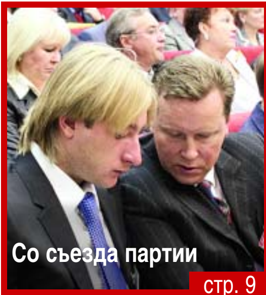
Со съезда партии