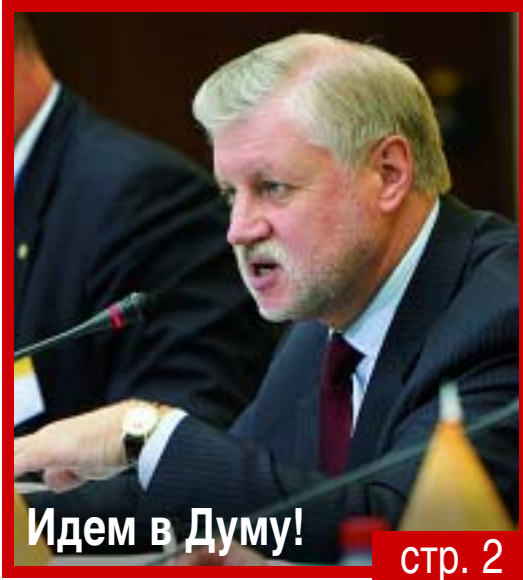
Идем в Думу!