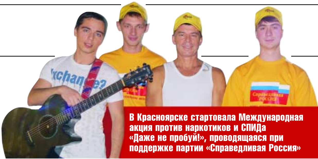
В Красноярске стартовала Международная акция против наркотиков и СПИДа «Даже не пробуй!», проводящаяся при поддержке партии «Справедливая Россия»