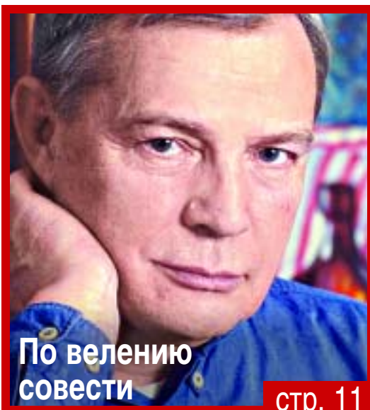
По велению совести