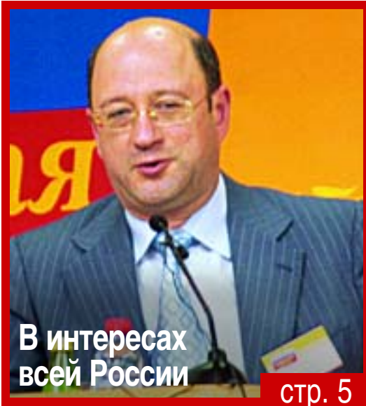
В интересах всей России