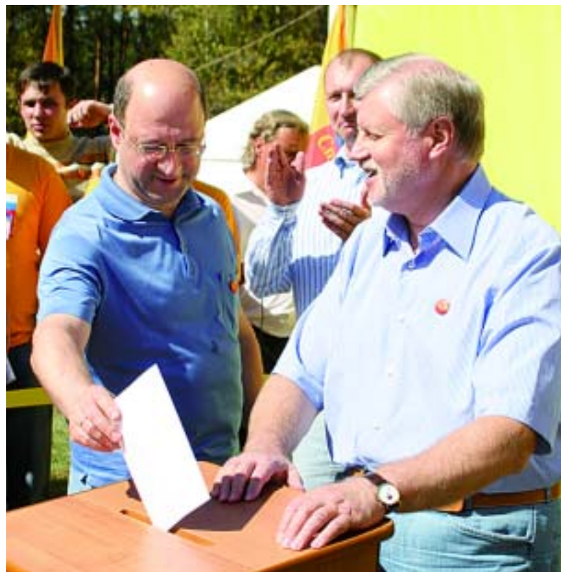
Сергей Миронов и Александр Бабаков в октябре собираются вынести законопроекты фракции на общественное голосование, чтобы с помощью народного референдума определить повестку дня для Думы нового созыва.

Все эти вопросы нужно решать немедленно, у государства на это есть деньги.